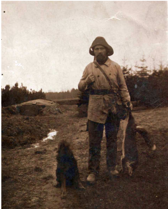
Min farfar efter en vellykket jagt.