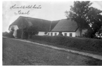
Lindholthus omkring 1915

Manden masede og masede. Men det var ham umuligt at komme videre. Det var som usynlige hænder holdt ham tilbage. Omsider hørtes et tungt opgivenessuk. Manden smed rebet. Og hulkende gik han ned ad stigen.