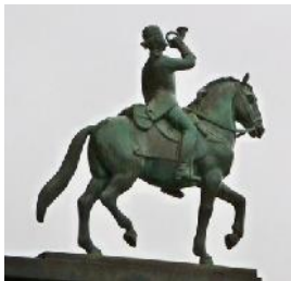
En postrytter udenfor Skanderborg Posthus