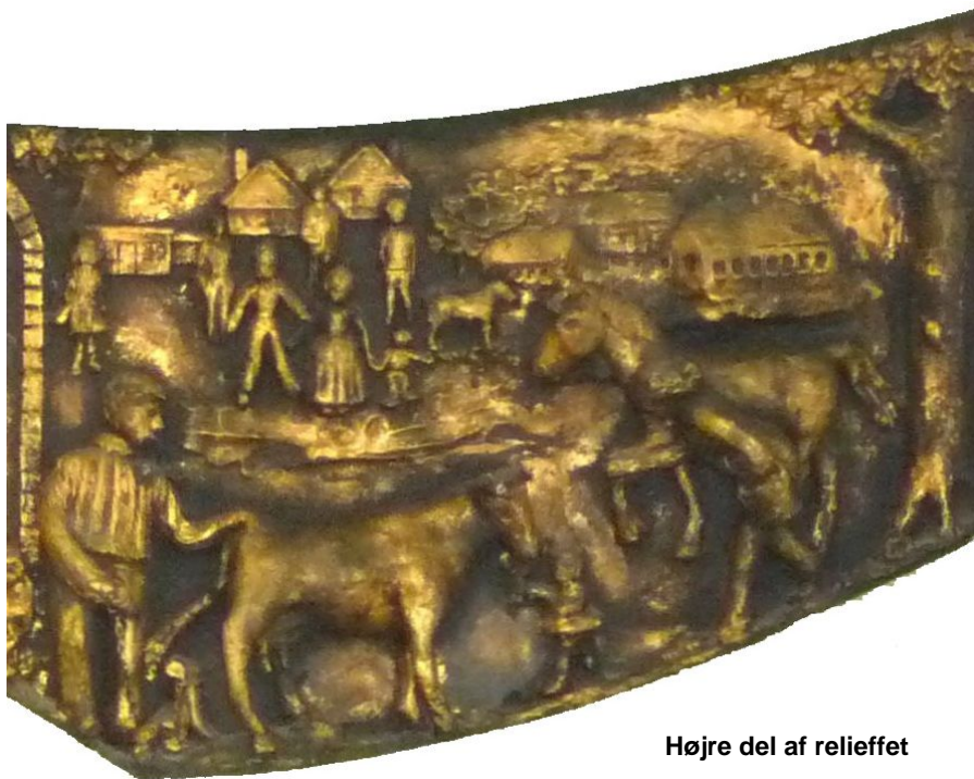
Højre del af relieffet