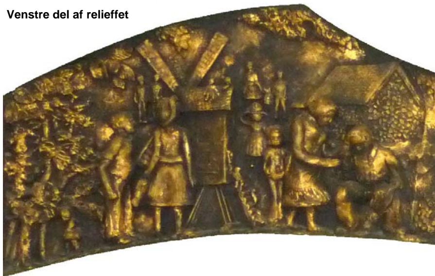
Venstre del af relieffet