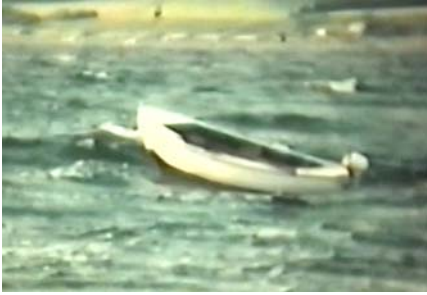
Sjægten, her uden mast, liggende ud for stranden.

Var der stadig nogle fisk i overskud, saltede Bedstemor dem og trak dem på et stykke ståltråd. Så blev de hængt til tørre. Når de var tørret, kom de op på loftet. Så kunne vi gå op og tage af dem til vinter. De var gode, når de blev kogt eller klippet i strimler.