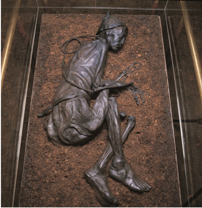
Tollundmanden i Silkeborg Museum.

Skive Folkeblad har på en af de sidste sider en rubrik, som hedder "De gamle nyheder". D. 10 juni i år refererede de til en notits i "Holstebro Avis", der fortalte om fundet af et lig i en mose ved Sevel. Dagen efter kom endnu en notits i "Holstebro Avis", som vi bringer starten på herunder. Den fulde tekst står i den grønne boks!