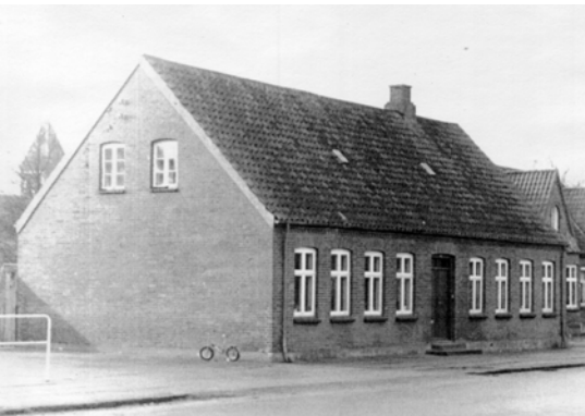
Sevelvej 12 omkring 1970. Man aner lidt af de gamle udhuse til venstre i billedet.