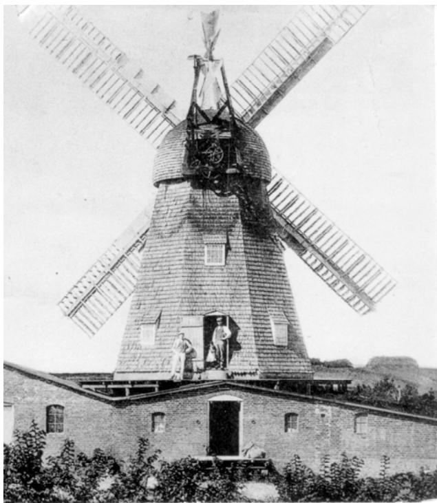
Djeld mølle omkring 1930

I 1976 blev møllen revet ned efter at have stået uden vinger i en periode, og mølleriet fik plads i nye huse. Møllen blev endelig nedlagt i 1994.