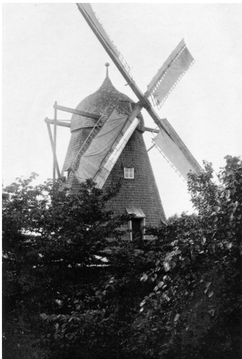
Vinderup Mølle set fra fotograf Hans Povlsens vindue

storm vingerne af møllen (en anden kilde siger, at akslen knækkede), og Niels Jensen erstattede den med en vindrose samt en petroleumsmotor til hjælp. Heller ikke denne vindrose fik lang levetid, hjulkammene i tanghjulene knækkede, og i 1914 blev den nedrevet og erstattet med en dieselmotor, senere med elektricitet. Dieselmotoren var dog periodisk i drift helt op til omkring 1960.