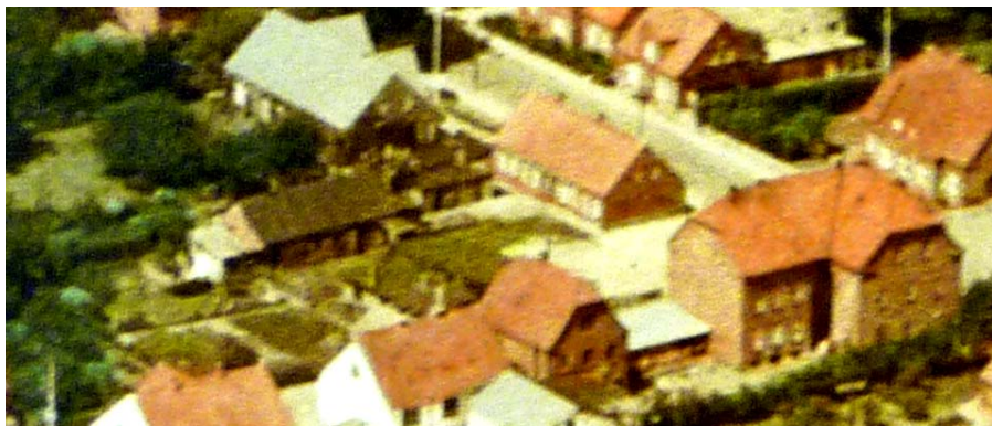
Luftbillede af Sevelvej og Kapelvej. Det er fra før udhusene tilhørende Sevelvej 12 i midten til venstre i billedet blev fjernet. Det høje hus til højre er Postgården.