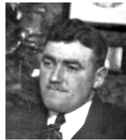
Et sjældent billede, hvor familien ses sammen med deres juletræ.