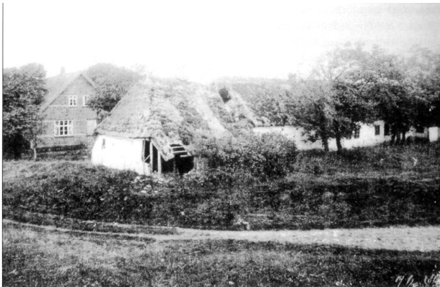
Estvad Præstegård omkring 1905-1910. I forgrunden ses den gamle præstegård i stærkt forfald. Bag den ses gavlen af den nye præstegård fra 1877.

Medens jeg sad i min stue, bankede det på døren, og ind trådte en yngre mand fra sognet, som jeg havde truffet nogle gange, og jeg forstod straks på hans optræden, at han havde det ligesom jeg og var sandelig langt nede. Han kom for at søge råd i sin vånde, han syntes ikke, han kunne få fred med Gud i sit hjerte og kom nu til sin sognepræst for at få råd. Jeg blev forfærdet, thi jeg trængte jo ligeså meget som han til lys og klarhed, og han kom til mig! Men jeg var jo hans sognepræst, og han kunne forlange hjælp af mig. I min nød foreslog jeg ham om vi ikke skulle bede sammen. Vi knælede da ned ved siden af hinanden på gulvet og bad om hjælp og klarhed, og da vi stod op fra bønnen, følte vi os styrkede og hjulpne - og afskedsansøgningen blev aldrig skrevet.