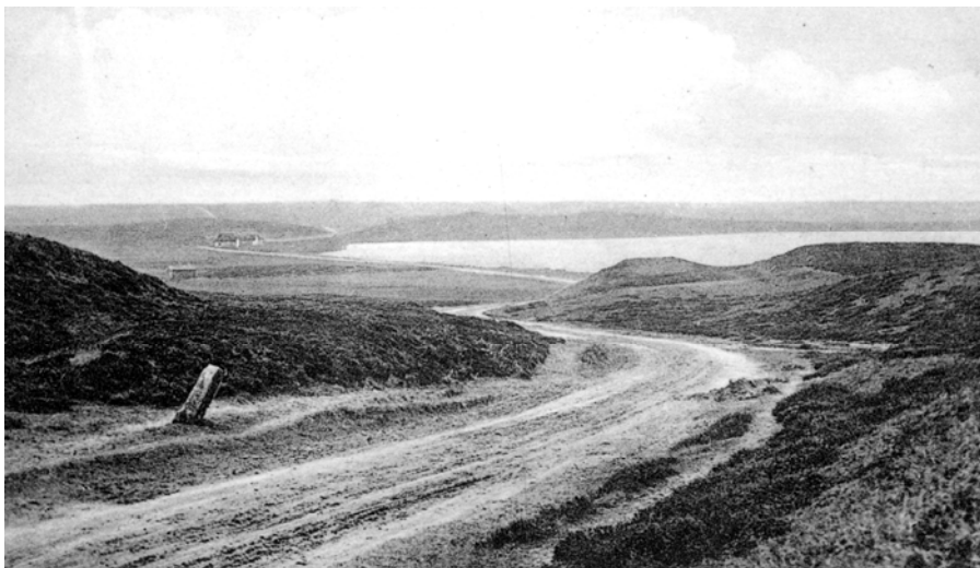
Den østlige ende af Flyndersø, set fra nord ca. 1910. Bag milestenen ses ålekisten ved Kholm Å og Flyndersø Møllens bygninger. Bemærk, at landskabet er træløst.