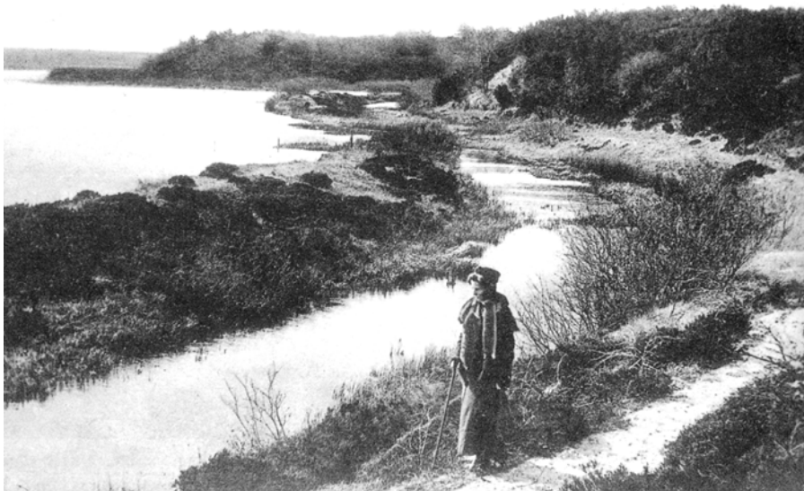
Et postkort fra omkring 1910. Afvandingskanalen fra forsøget på at udtørre Flyndersø 30 år tidligere er nu ved at gro til.

spredd omkring i heden, enten lige ved søen eller i større afstand fra den, nogle ejendommelige huller i jorden. De var cirkelrunde aftagende i diameter nedefter. Dybden var meget forskellig. Enkelte kunne være meget store og dybe med mose i bunden, andre mindre dybe, men altså cirkelrunde.