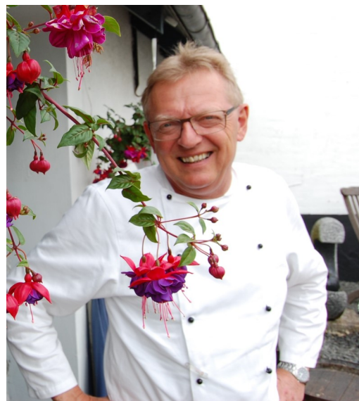
Øvrige bestyrelse, suppleant og revisorer blev genvalgt.

Der henvises til særskilt årsberetning på hjemmesiden.