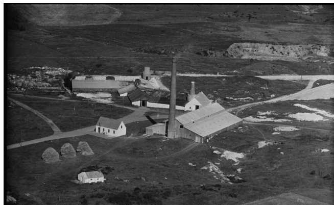
Sevel Kalkværk omkring 1950.

Søkonsortiet blev ramt af uheld og gik konkurs, og Søndermølle Kalkværk blev afløst af Sevel Kalkværk.