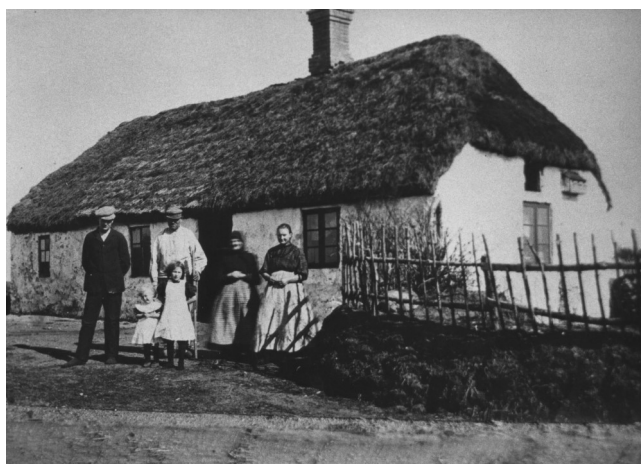
Flintehuset ved Sevel Kalkværk omkring 1900. Dette hus var bygget af store flintknolde fra kalkgraven.

Det var netop tanken bag Sevel Kalkværk, at der skulle sælges til det store marked, der var i Vestjylland, og man tog konkurrencen op med