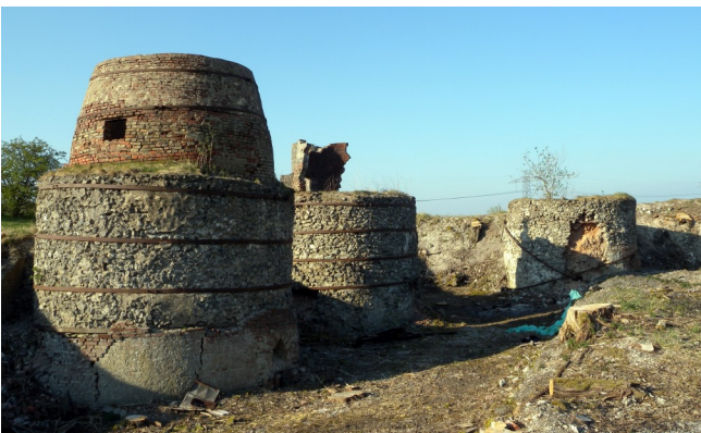
Resterne af de tre potovne.

Der hviler en egen ro og melankoli over stedet, hvor man aner, at der for mange år siden har