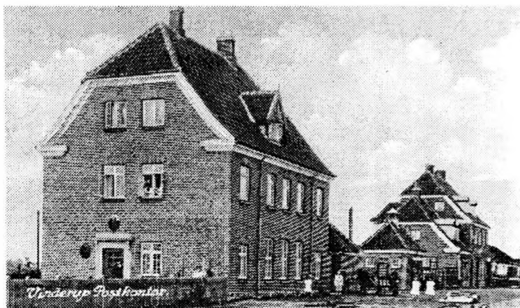
Posthuset fra 1915 inden tilbygningen i 1972

Den 17. november 1865 blev jernbanestrækningen Skive-Struer åbnet, og som det blev omtalt i datidens sprog m e d d e l t e generalpostdirektøren i cirkulære af 9. december 1865, at der fra den 18. november samme år i Vinderup var oprettet